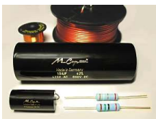
Crossover : uso di condensatori ad alta precisione MKP, resistenze a film metallico a bassissima tolleranza, induttanze avvolte in aria a bassissima distorsione.