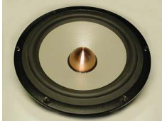
Woofer/midrange con cono in magnesio estremamente rigido