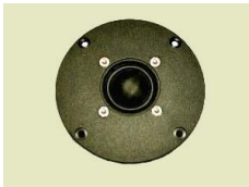
Tweeter a cupola morbida con doppio magnete